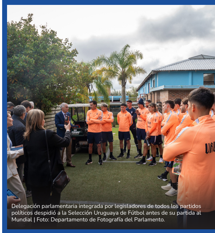
Delegación parlamentaria integrada por legisladores de todos los partidos políticos despidió a la Selección Uruguaya de Fútbol antes de su partida al Mundial | Foto: Departamento de Fotografía del Parlamento.

La Comisión de Transporte y Obras Públicas de la Cámara de Senadores comenzó a estudiar el proyecto de ley que reduce las multas por exceso de velocidad en rutas nacionales, que tiene media sanción de diputados.