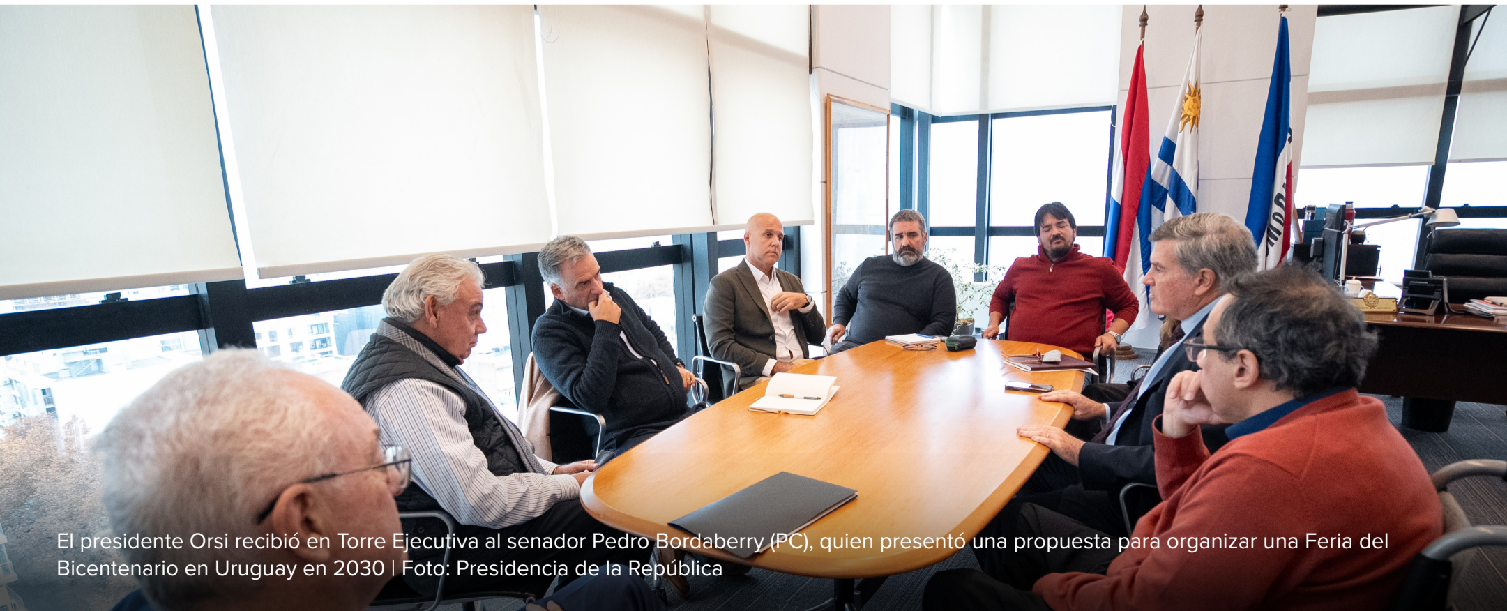
El presidente Orsi recibió en Torre Ejecutiva al senador Pedro Bordaberry (PC), quien presentó una propuesta para organizar una Feria del Bicentenario en Uruguay en 2030

MSP, MIDES, ASSE y la Secretaría Nacional de Drogas presentaron un programa de asistencia sanitaria integral para personas en situación de calle, con foco en salud mental, consumo problemático, policlínicos móviles, unidad de enlace y aumento de camas en centros de salud.