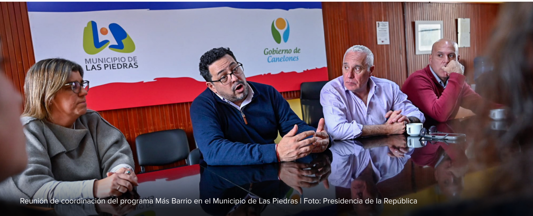
Reunión de coordinación del programa Más Barrio en el Municipio de Las Piedras

El Ministro del Interior, Carlos Negro, anunció el cambio del Jefe de Policía de Montevideo, del Jefe de la Guardia Republicana, el Director de Investigaciones y de Asuntos Internos.