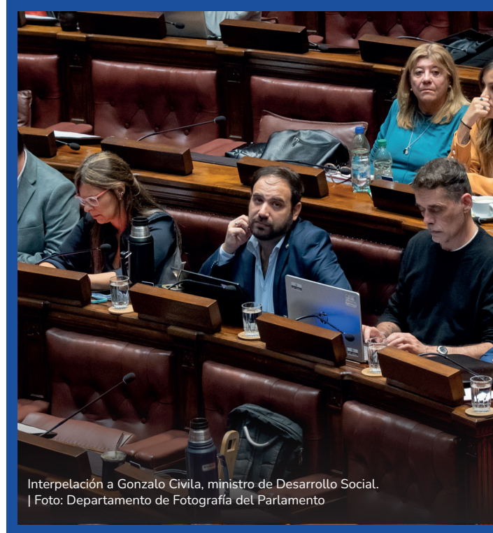
Interpelación a Gonzalo Civilia, ministro de Desarrollo Social.

El Senado aprobó el proyecto de ley de empleo integral del Poder Ejecutivo. Durante el tratamiento se incorporaron modificaciones impulsadas por la oposición, entre ellas la reducción de 50 a 45 años de la edad mínima para acceder a los beneficios. La iniciativa pasó a Diputados.