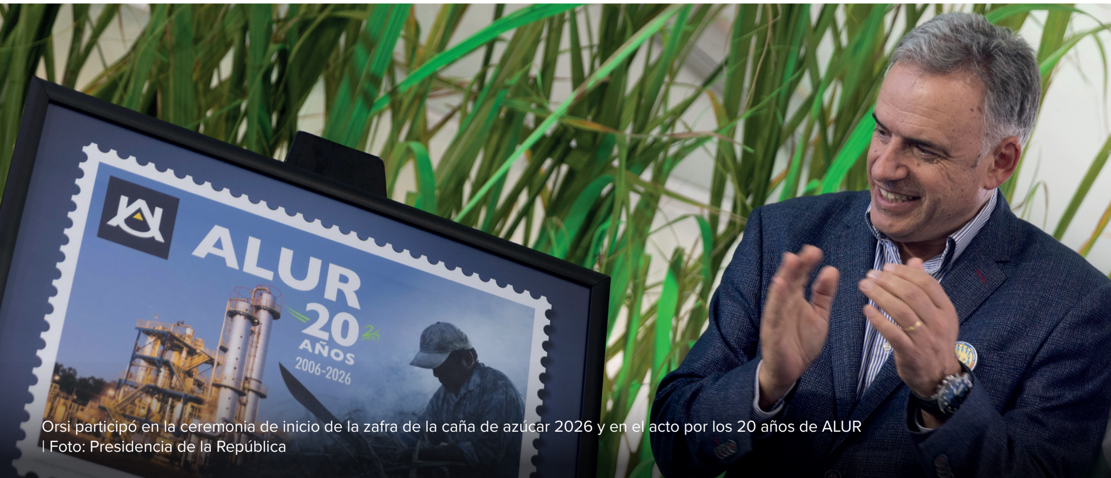
Orsi participó en la ceremonia de inicio de la zafra de la caña de azúcar 2026 y en el acto por los 20 años de ALUR

El Poder Ejecutivo lanzó la edición 2026 del programa de empleo y capacitación, con una inversión de 350 millones de pesos y 5.500 cupos. Las inscripciones abren el 1° de junio. Por primera vez, se incorpora un cupo especial para liberados del sistema penitenciario y personas en situación de calle.