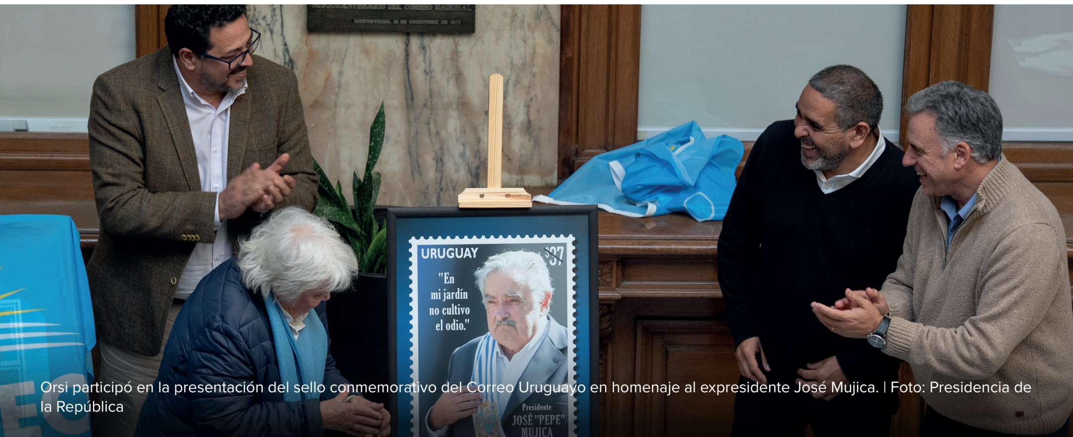
Orsi participó en la presentación del sello conmemorativo del Correo Uruguayo en homenaje al expresidente José Mujica.

Quedó activo el nuevo portal de la Oficina Nacional de Servicio Civil, herramienta única para el proceso de acceso a la función pública.