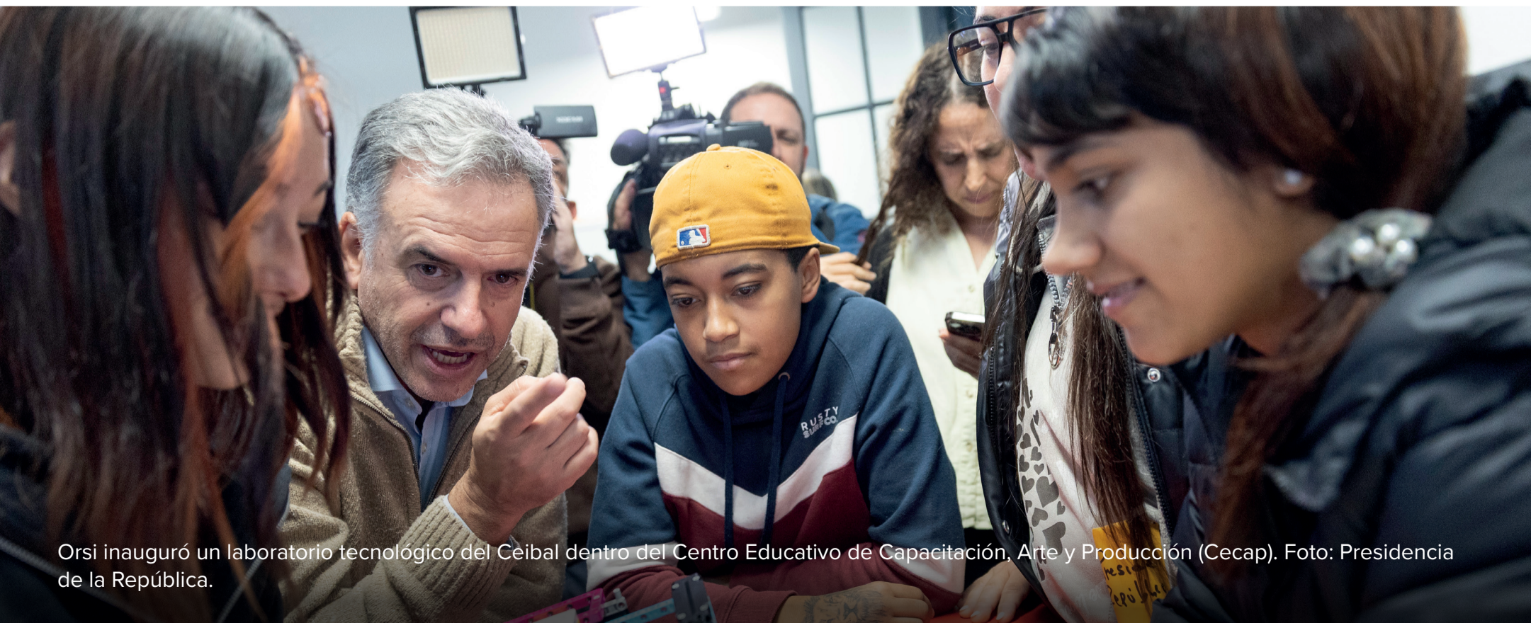
Orsi inauguró un laboratorio tecnológico del Ceibal dentro del Centro Educativo de Capacitación, Arte y Producción (Cecap).

El Poder Ejecutivo anunció que Uruguay presentará su candidatura para presidir la próxima Conferencia Internacional del Trabajo de la OIT, que se realizará en Ginebra, Suiza. En ese marco, el presidente Orsi y el ministro de Trabajo, Juan Castillo, mantuvieron reuniones con el director general de la Organización Internacional del Trabajo (OIT), Gilbert Houngbo, quien destacó el modelo uruguayo de diálogo social y negociación colectiva.