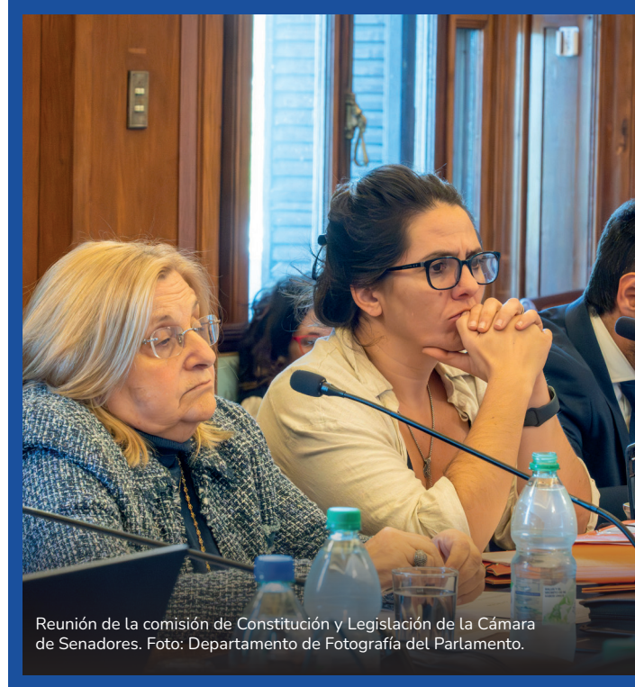
Reunión de la comisión de Constitución y Legislación de la Cámara de Senadores.

Comenzó a sesionar una comisión preinvestigadora sobre la gestión de la Administración de los Servicios de Salud del Estado (ASSE), que abarca desde 2015 hasta la actualidad, luego de que la oposición tomara la iniciativa en ese sentido.