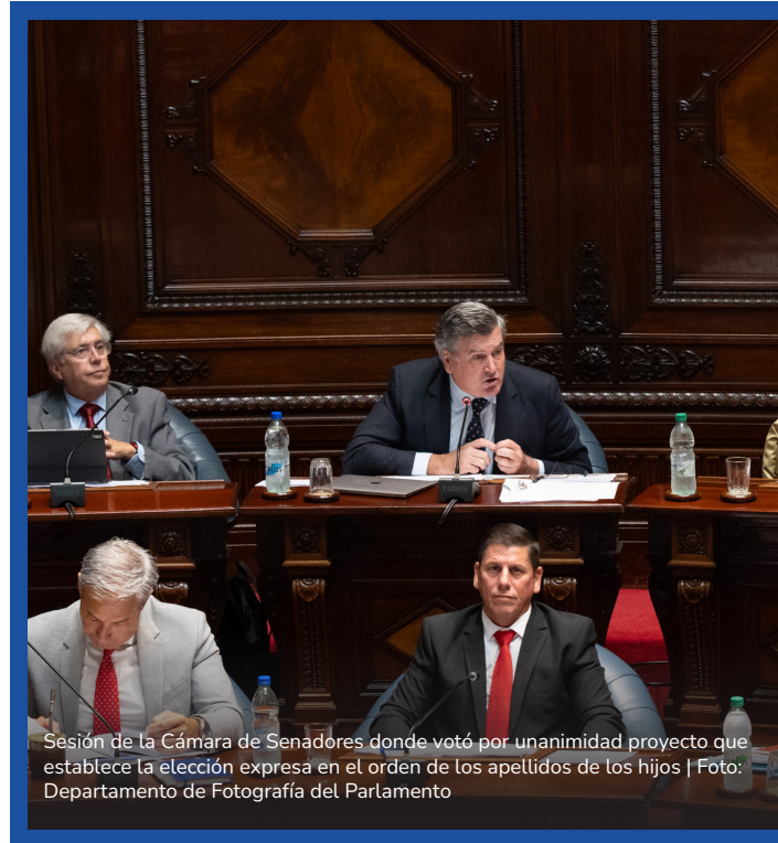
Sesión de la Cámara de Senadores donde votó por unanimidad proyecto que establece la elección expresa en el orden de los apellidos de los hijos

El ministro de Desarrollo Social, Gonzalo Civila, será interpelado en la Cámara de Diputados debido a la muerte de cuatro menores de edad que estaban al amparo del Instituto del Niño y Adolescente del Uruguay (INAU) entre diciembre de 2025 y febrero de 2026.