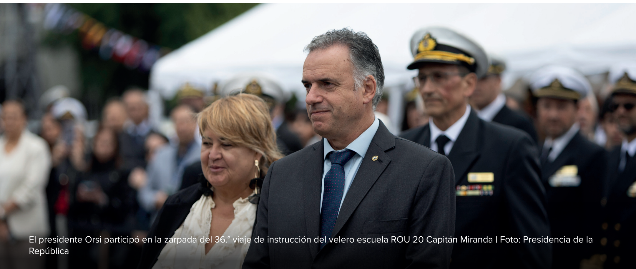
El presidente Orsi participó en la zarpada del 36.º viaje de instrucción del velero escuela ROU 20 Capitán Miranda

La Prosecretaría de la Presidencia organizó un conversatorio sobre el proyecto de reforma del Código del Proceso Penal (CPP), que propone modificar unos 180 artículos y fue elaborado por un grupo asesor técnico con representación de distintas instituciones, en base a un proceso de trabajo y consenso interinstitucional.