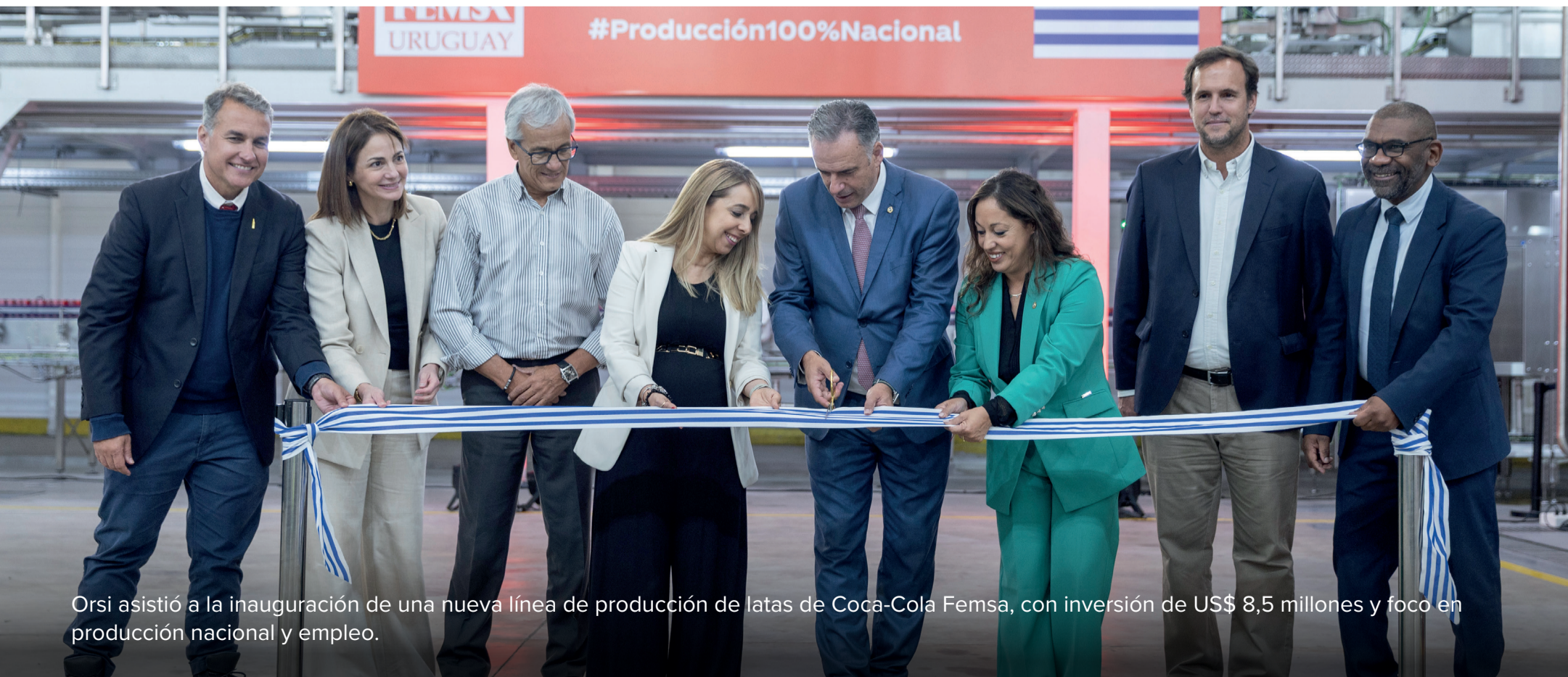
Orsi asistió a la inauguración de una nueva línea de producción de latas de Coca-Cola Femsa, con inversión de US$ 8,5 millones y foco en producción nacional y empleo.

El ministro de Economía, Gabriel Oddone, adelantó que se reunirá con el Ministerio de Industria y Ancap para definir el ajuste de los precios de los combustibles de cara a mayo.