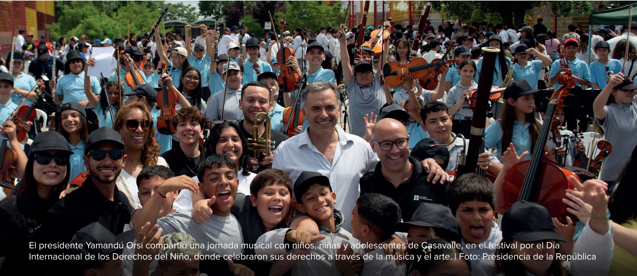
El presidente Yamandú Orsi compartió una jornada musical con niños, niñas y adolescentes de Casavalle, en el festival por el Día Internacional de los Derechos del Niño, donde celebraron sus derechos a través de la música y el arte.

Nuestro país fue aceptado por Australia, Brunei, Canadá, Chile, Japón, Malasia, México, Nueva Zelanda, Perú, Singapur, Reino Unido y Vietnam para sumarse al Tratado Integral y Progresista de Asociación Transpacífico, informó Cancillería.