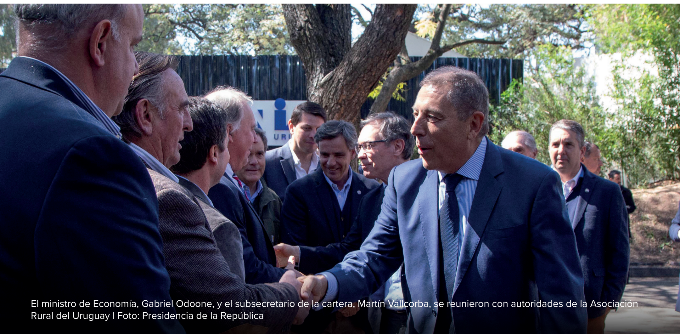
El ministro de Economía, Gabriel Odoone, y el subsecretario de la cartera, Martín Vallcorba, se reunieron con autoridades de la Asociación Rural del Uruguay

Orsi asistió a la presentación del Plan Quinquenal de Vivienda y Hábitat del Ministerio de Vivienda, que proyecta abarcar soluciones habitacionales para 69.334 hogares.