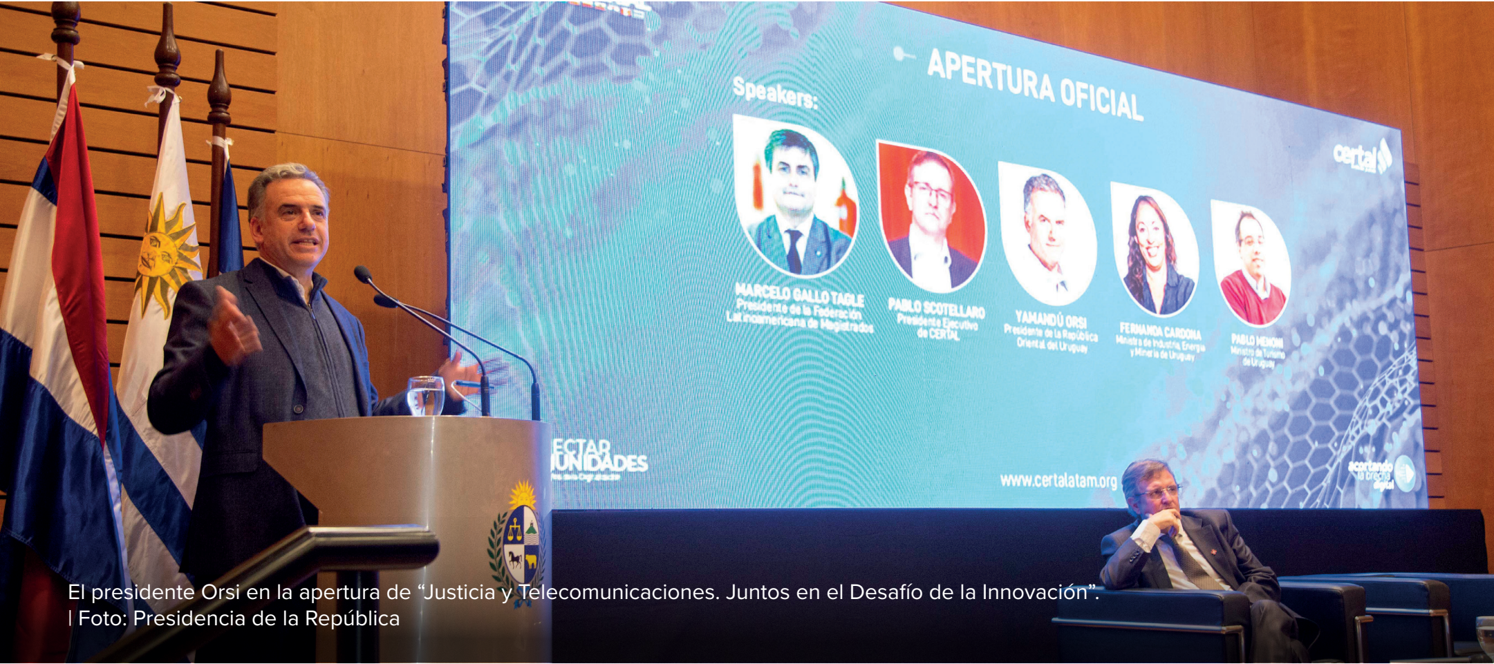
El presidente Orsi en la apertura de “Justicia y Telecomunicaciones. Juntos en el Desafío de la Innovación”.

Representantes del sector agropecuario pidieron una reunión con el ministro de Economía, Gabriel Oddone, para hablar sobre la decisión del Ministerio de Ganadería respecto de la suspensión del ganado en pie.